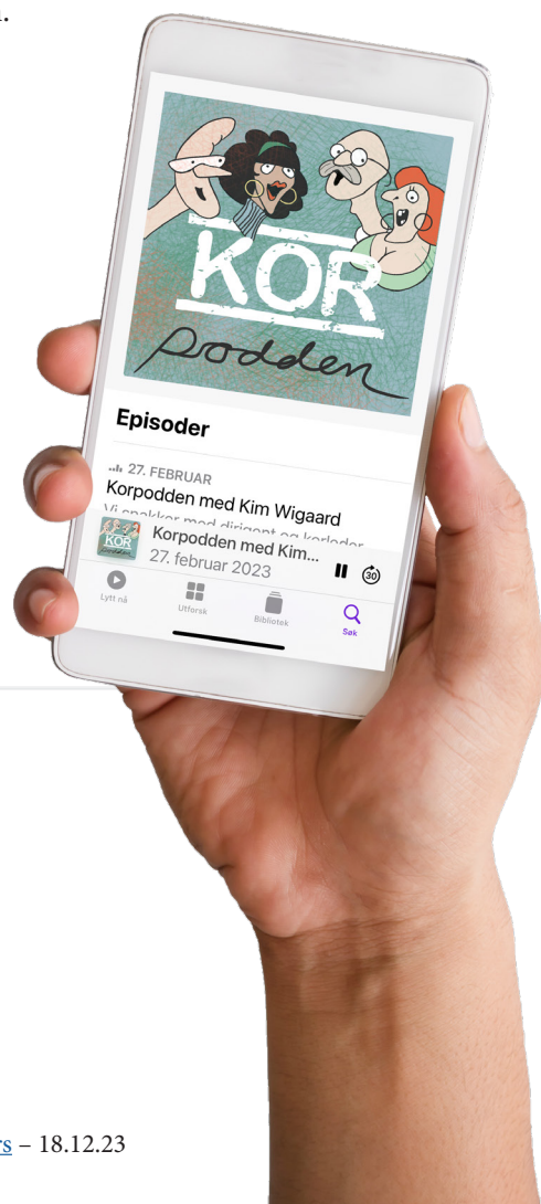
Totalt ble det spilt inn og publisert 10 episoder i 2023.

Hensikten med Korpodden er todelt. Vi ønsker å beholde og begeistre dagens medlemmer, og vi vil øke interessen for korsang hos unge voksne, og bidra til rekruttering.