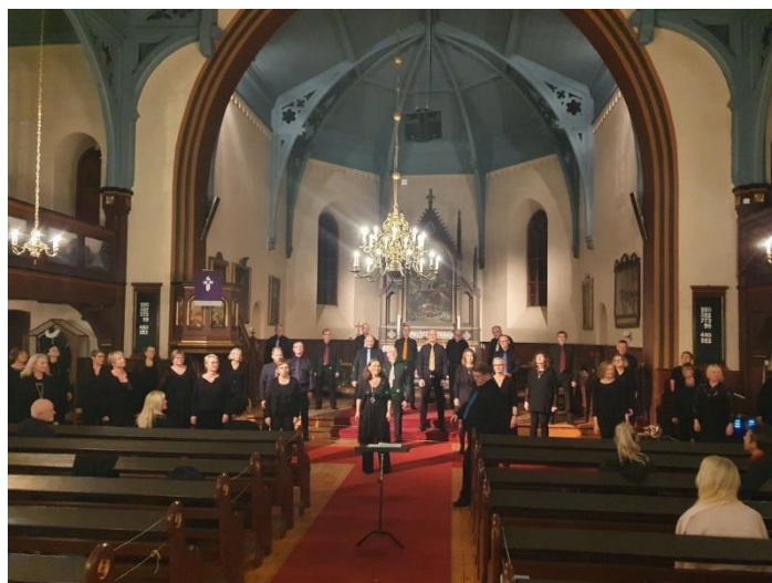
Ad Libitum i Orkdal kirke.