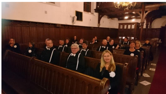
Songlaget Våren på plass i Ilen kirke.