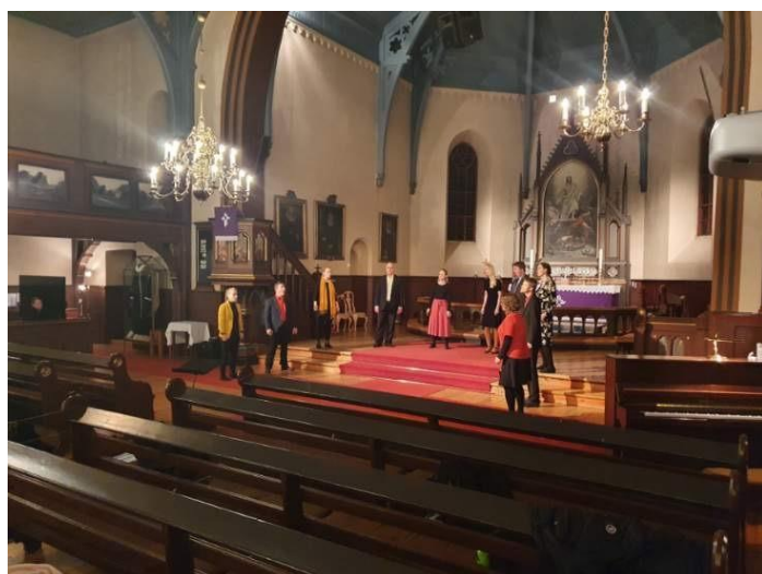
Konsonantkompaniet i Orkdal kirke.