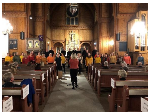
Malvik Blandakor i Strinda kirke.