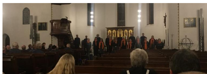
Sjetnekoret i Ilen kirke.