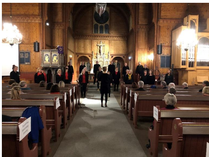
Melhus Songlag i Strinda kirke.