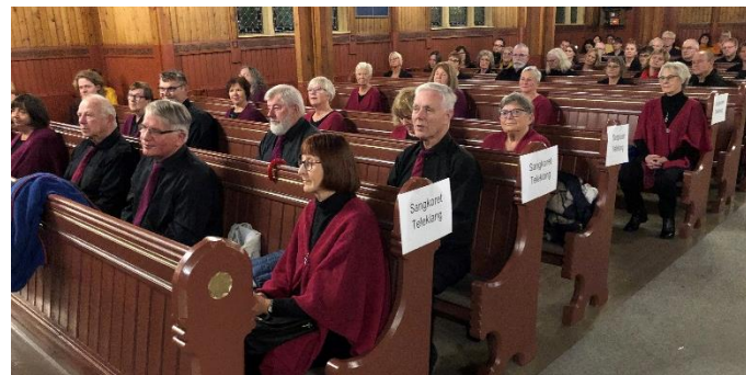
Sangkoret Teleklang sine rekker i Strinda kirke.