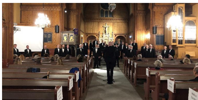
Trøndernes Mannsangforening i Strinda kirke.