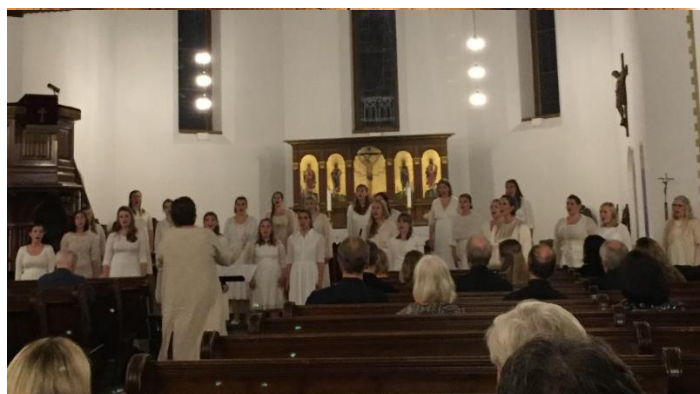
Cantus i Ilen kirke.