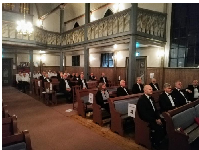
På rekke og rad i Nes kirke. Foran: Ørland Sangforening. Bak: Valsfjord Mannskor.