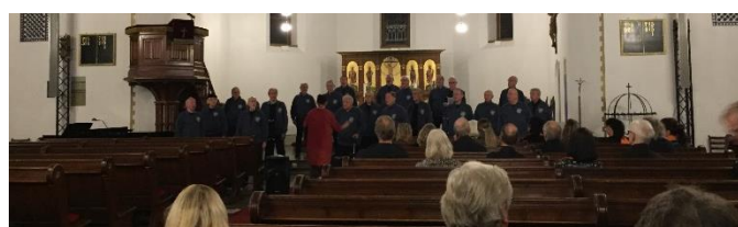
Mannskoret Nøkken i Ilen kirke.