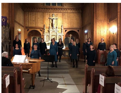
Damekoret Hedda i Strinda kirke.