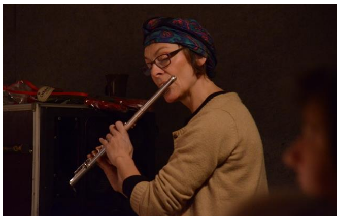
^ Juleforestillingen "Litj-Johan på Nerøra" med Orklang (2013).