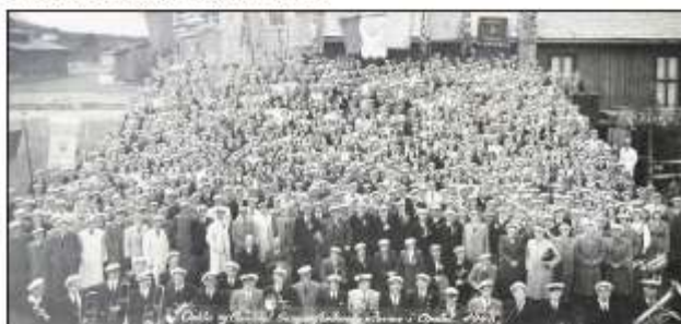
Songarstemne Oppdal 1948