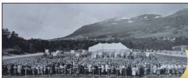
Songarstemne Oppdal 1963