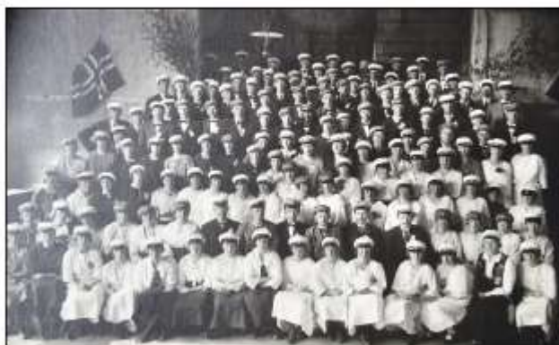
Songarstemne Oppdal 1923