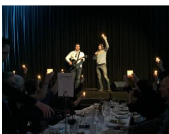
Høy allsangfaktor med underholdningen Otr&Pjotr ...