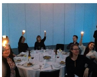
... Og ikke minst skyhøy lighterføring!