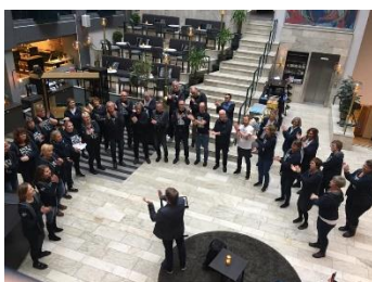
Ad Libitum holdt minikonsert i foajeen på lørdag.