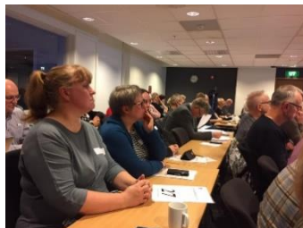
Tillitsvalgte på rekke og rad under årsmøte.