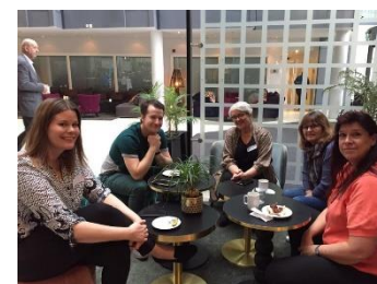
Deltakere fra Malvik Blandakor og Byneset Songlag.