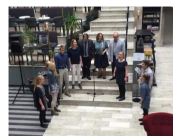
Minikonsert med Konsontantkompaniet på søndag.

Takk for deltakelsen til alle tillitsvalgte, dirigenter og instruktører!