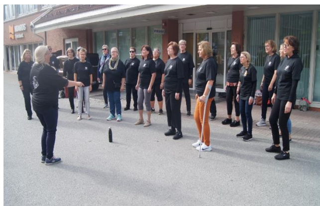
Sang av Klæbu Damekor foran veteranbilutstillinga ved banken Klæbu sentrum.

Klæbu Damekor gleder seg over å være samlet igjen etter vårens digitale øvelser.