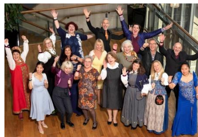
^ Med sangkor HARMUNDI, NM 2019