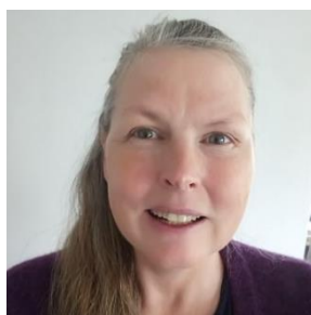
Kari Osvoll Sjetnekoret

Ukentlige stemmeøvinger på Skype har vært et fint holdepunkt i en rar hverdag. Det har vært fint og sett hverandre og iallfall sunget tostemt; dirigenten har spilt akkompagnement og sunget en annen stemme enn vår, mens vi korsangerne har sunget vår stemme hjemme i stua. Vi har også møttes på Skype for å gjennomføre Kahoot med diverse musikkuttrykk, som har vært en artig måte å lære litt andre ting på, enn det vi kan prioritere på vanlige korøvelser.