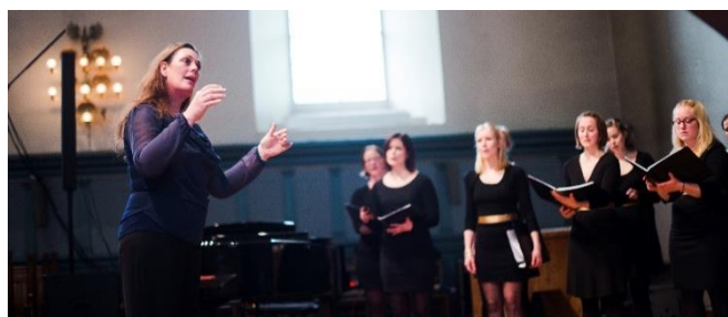
^ Med Kammerkoret Aurum 2015

Alle de tingene blir tenkt på gjennom aktivitetene fra disse viktige støttespillerne. Det er de som organiserer at det blir mulig å skape en bedre verden sammen ved å møtes og ved å undres over alt som er mulig å gjøre med sang som en stemme utad. Lenge leve korsang!